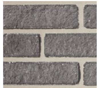
Steel Gray 591-DR