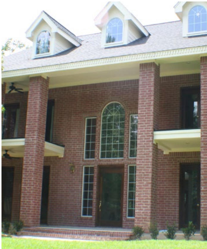
541- R, Fuego