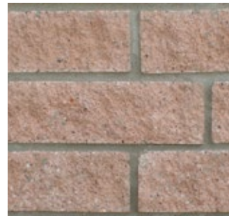
Walnut Brown 531-R