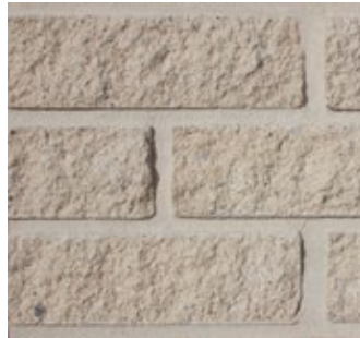
Light Buff 561-R