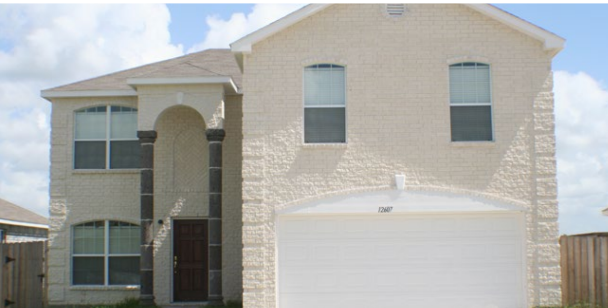
561- R, Light Buff