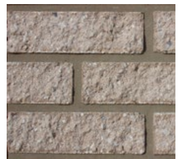
Sand Stone 571-R