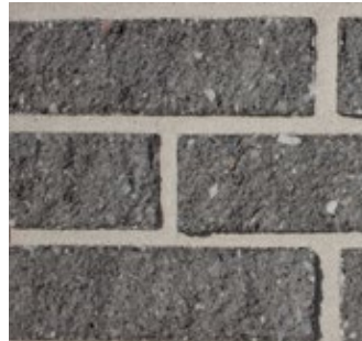
Slate Gray 521-R