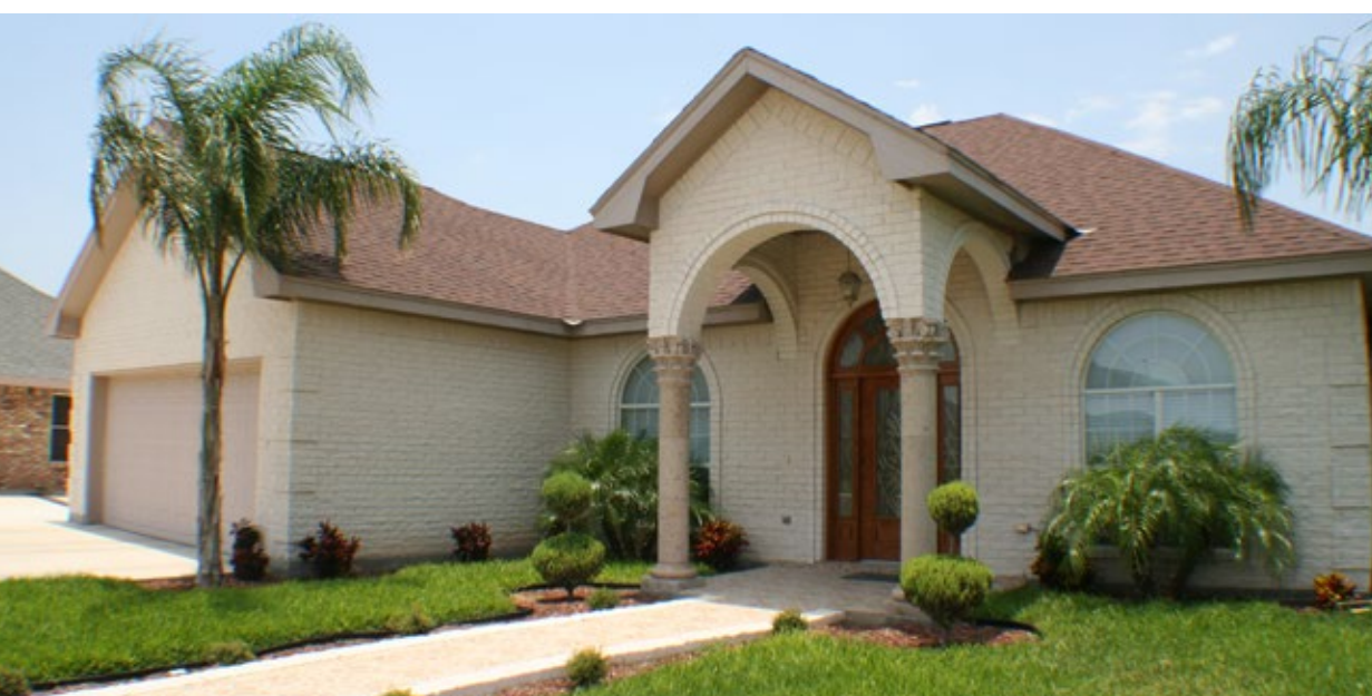
591- R, Ivory