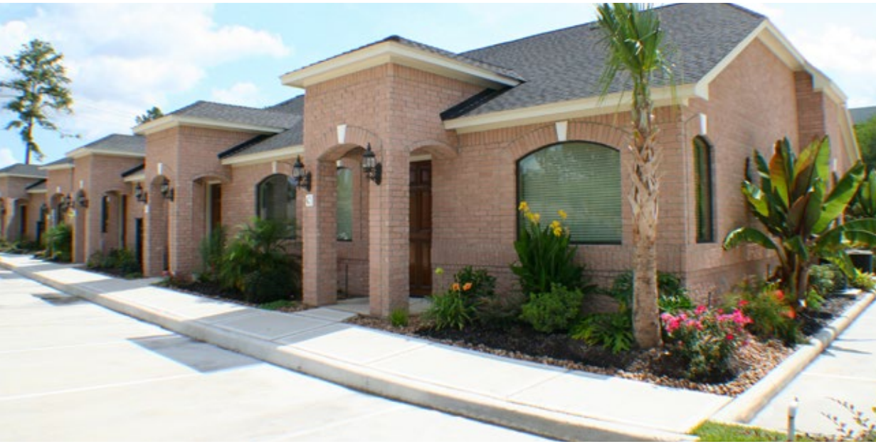
531- R, Fuego