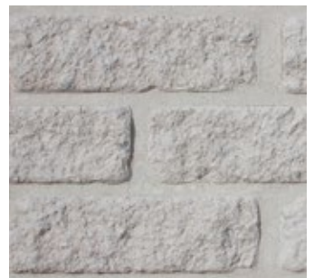
Arctic White Tumbled 501-RT