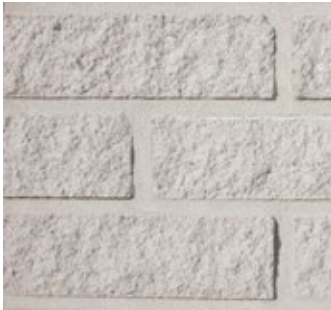
Arctic White 501-R