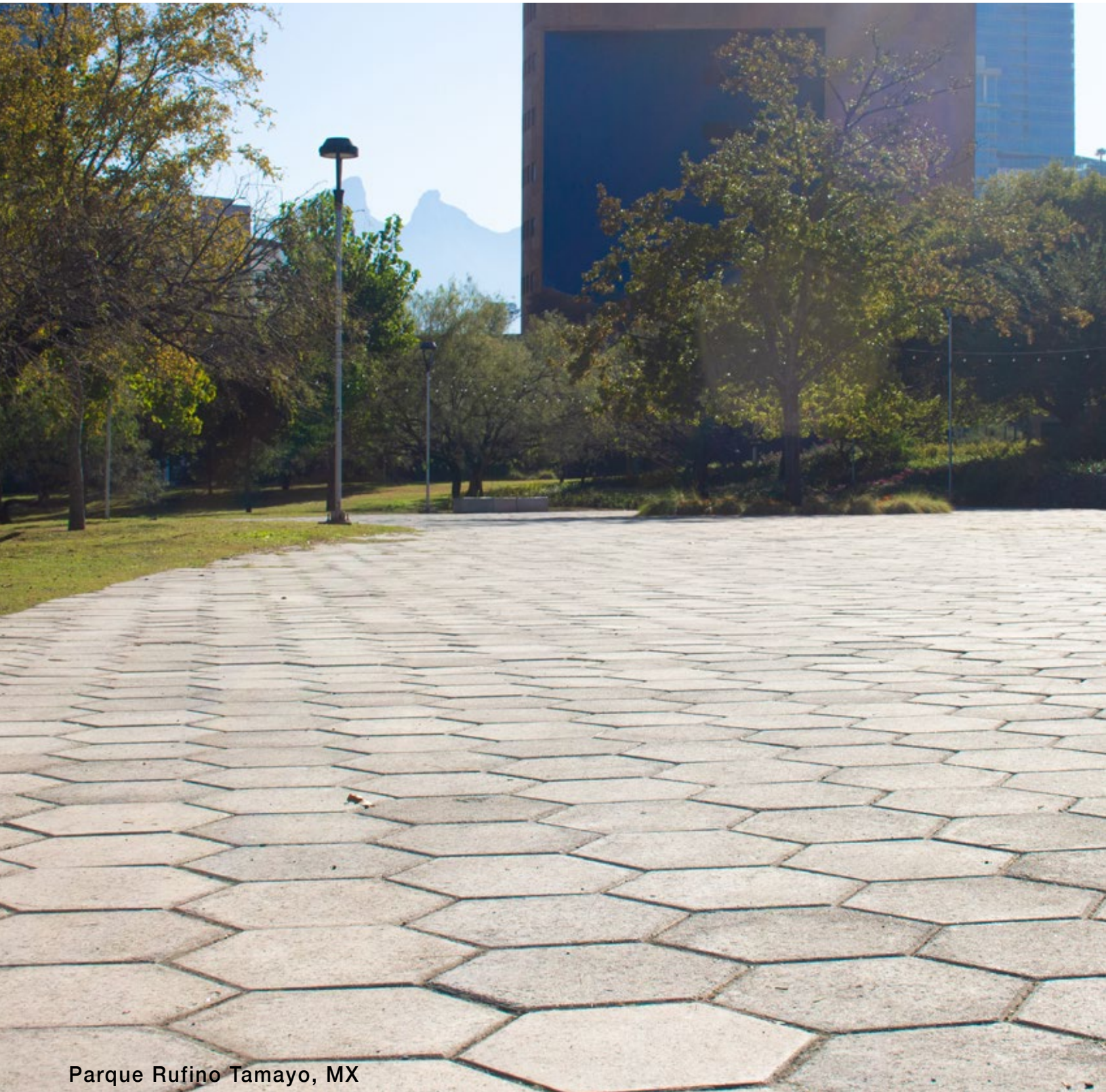
Parque Rufino Tamayo, MX