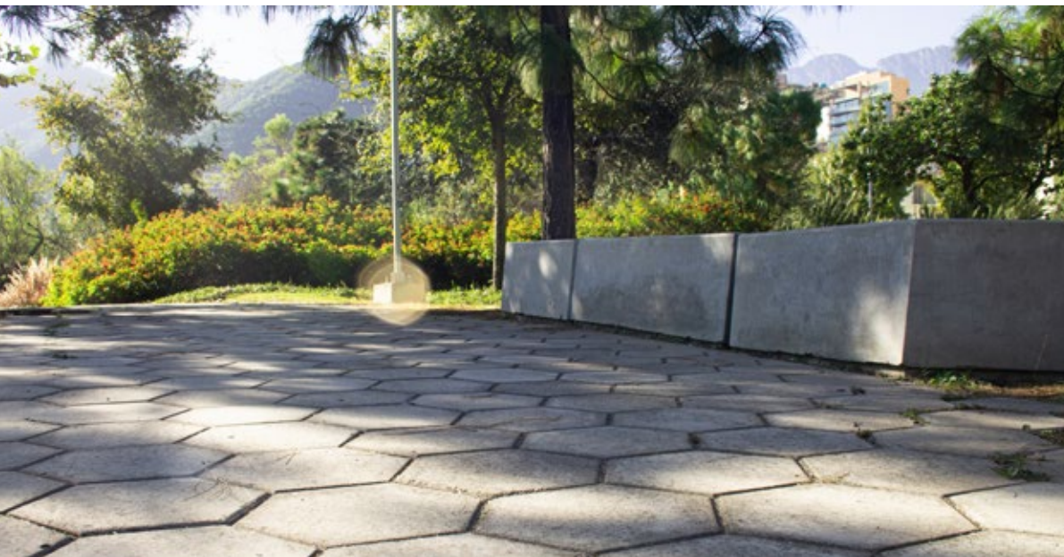
Parque Rufino Tamayo, MX