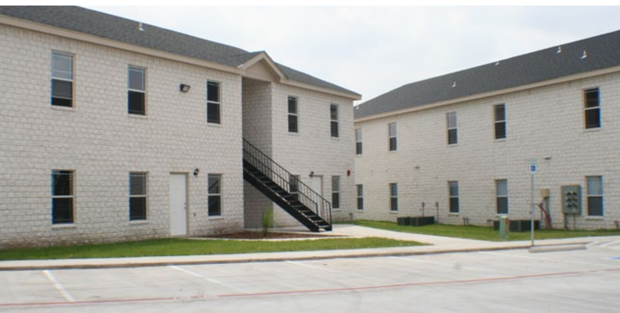
1001-RT, White Stone Tumbling