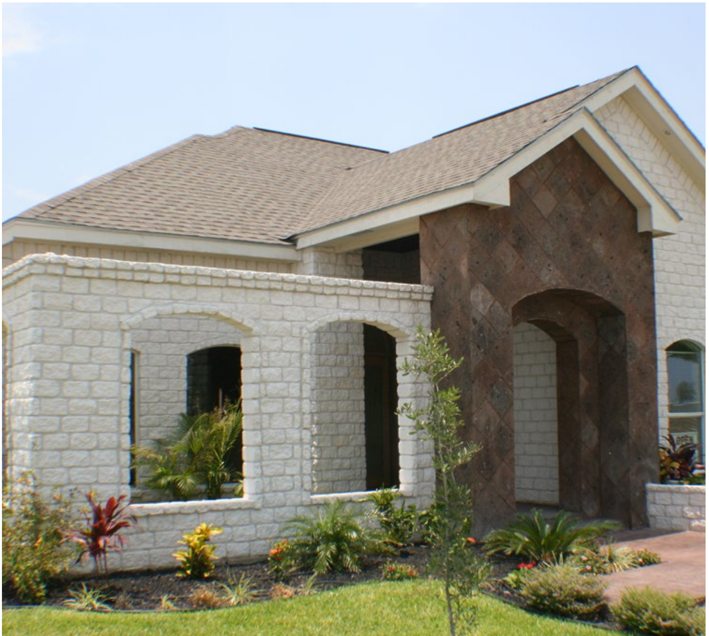
1001-RT, White Stone Tumbling