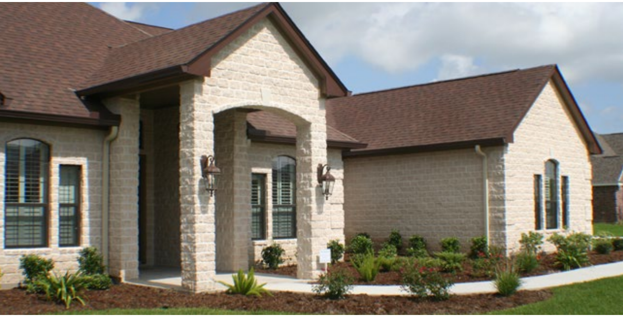
1013-RT, Adobe Stone Tumbling