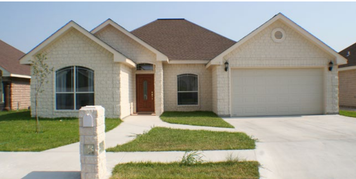
1061-RT, Light Buff Stone Tumbling